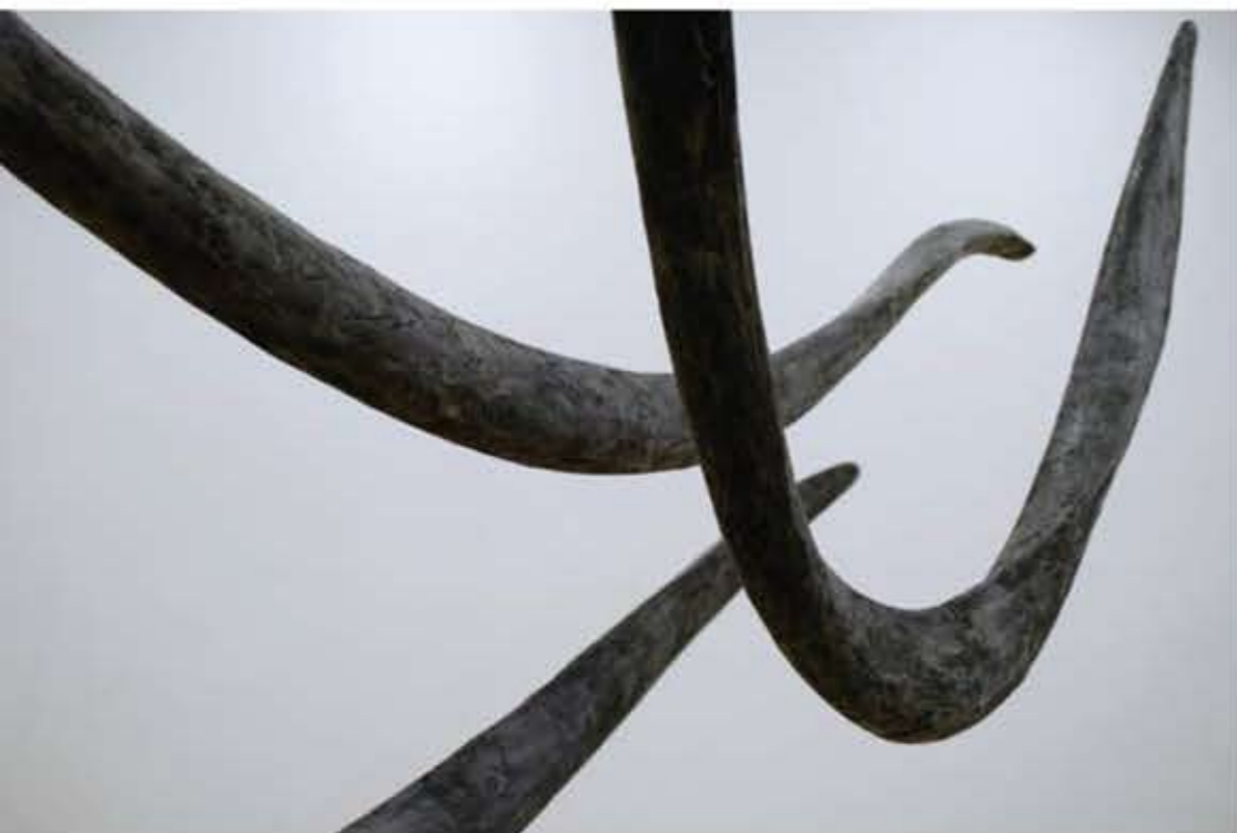
Životopis, 2007. Polistiren, akril, stakleno tkanje, crni vosak, fotografije na kapafixu (60 kom., 13 x 18 cm) 115 x 222 cm, 350 x 150 x 150 cm, 700 x 630 x 50 cm, 540 x 150 x 150 cm, Galerija Karas, Zagreb