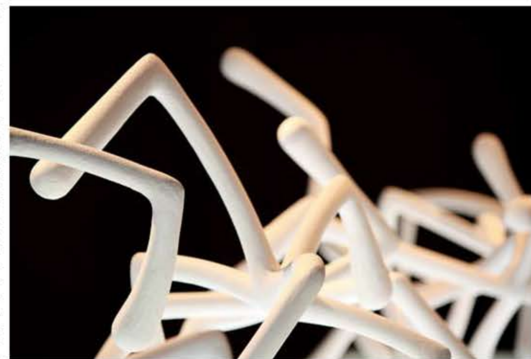
Izazov svjetlosti, 2002. Osam skulptura od epoksidne smole i staklenog tkanja; dimenzije varijabilne, bočni paneli od biela-stične tkanine, Galerija SC, Zagreb

Imam veliku averziju kada se raspiše natječaj za žiriranu skupnu izložbu na kojoj je već unaprijed postavljena tema, pitanje na koje trebam odgovoriti. Njih ne zanima što ja inače radim, nego kako ću se uklopiti u njihovu ideju. Previše dominiraju kustoske koncepcije, previše se toga nameće.