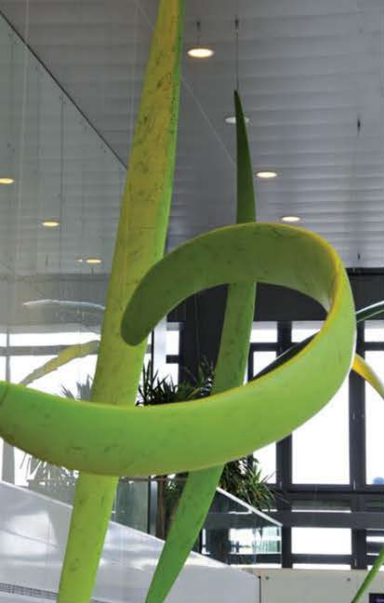
Biofori, 2008. polistiren, epoksidna smola, stakleno tkanje, kit punilo, uljni lak, čelične sajle, devet objekata duljine od 300 do 600 cm Erste&Steiermärkische banka, centrala Zagreb

u njihovu ideju. Previše dominiraju kustoske koncepcije, previše se toga nameće. Moram priznati da najčešće ni ne pročitam propozicije ili teme natječaja, nego prijavim ono što trenutno radim. Pa što bude.